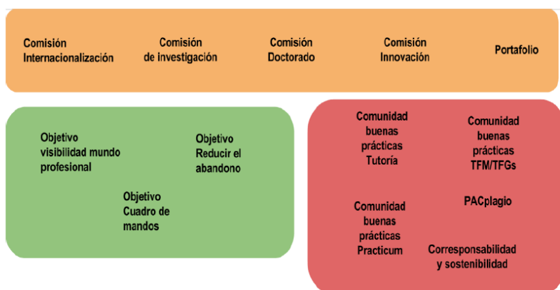
Imagen. Comisiones, objetivos y comunidades de buenas prácticas

Igualmente, los Estudios disponen de diversos mecanismos internos de mejora continua que se evidencian en los diferentes grupos de trabajo, comisiones y objetivos, tal y como se pone de manifiesto en el informe de seguimiento de centro. Durante el curso 2015-2016, las comisiones (véase la imagen 2) trabajan de forma permanente en diversos aspectos estratégicos para los Estudios, como son la internacionalización de los programas, el impulso de la investigación, la implementación de acciones innovadoras en todos sus programas, y el planteamiento de nuevas propuestas y fórmulas de portafolio de las titulaciones que se ajusten a las necesidades sociales.