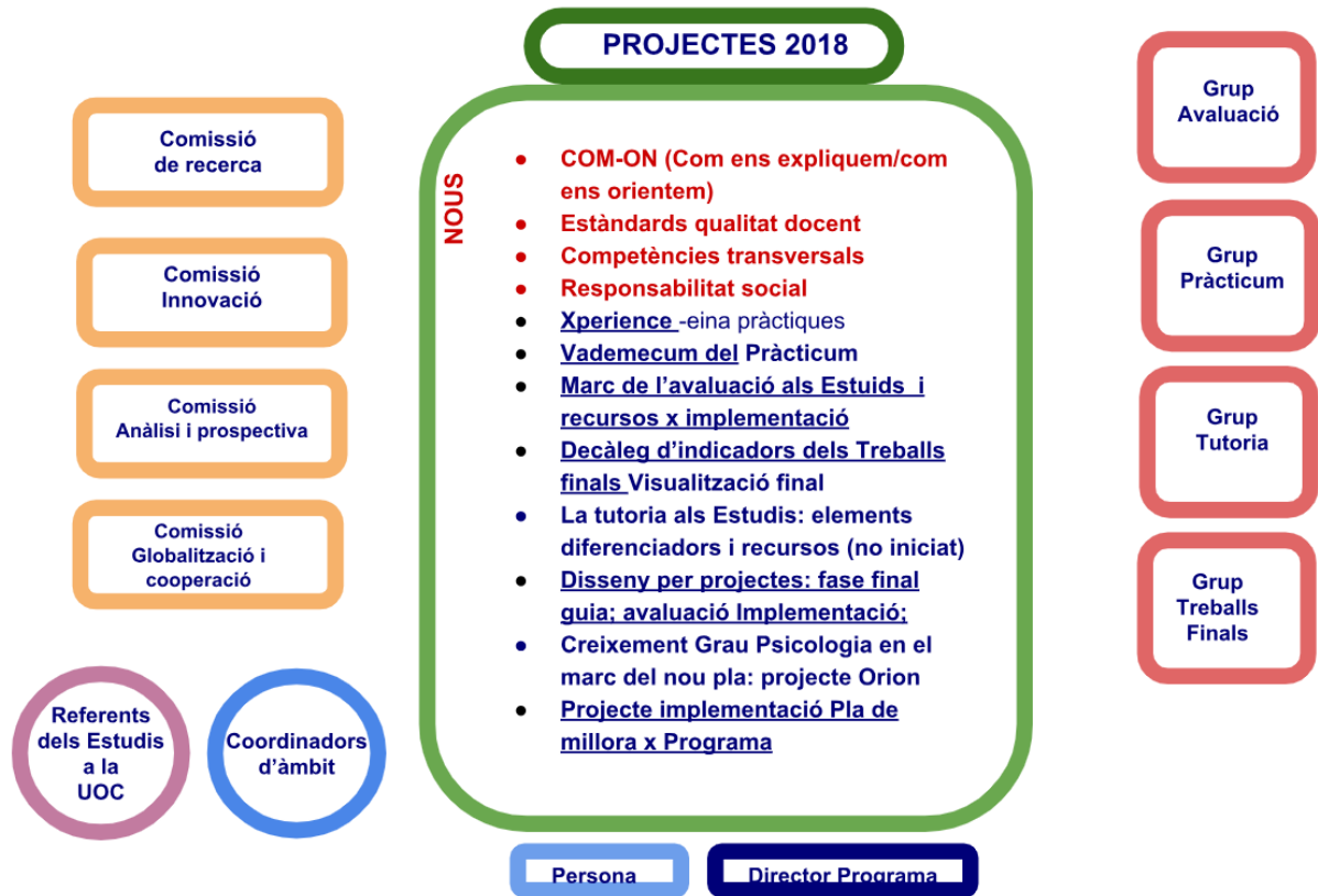
Imatge 2. Quadre de projectes 2018

articulat per mitjà de projectes, que es treballen dins de les diferents comissions i grups, però també mitjançant encàrrecs a determinats membres de l'equip. Tots aquests mecanismes reverteixen en benefici tant del procés de disseny de noves titulacions com del procés de recollida d'informació, a fi de dissenyar propostes de millora dels resultats d'aprenentatge de les diferents titulacions, incloses les dues objecte d'avaluació.