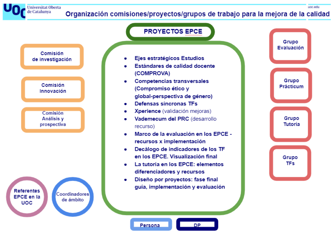
Imagen 1. Cuadro de proyectos 2020

Los Estudios disponen de diferentes mecanismos internos de mejora continua que se evidencian en los grupos de trabajo, las comisiones y los objetivos específicos anuales, alineados con los del plan estratégico de la universidad. Desde 2016, los objetivos se han articulado mediante proyectos, que se trabajan dentro de las diferentes comisiones y grupos, pero también mediante encargos a determinados miembros del equipo ( Imagen 1 ). Todos estos mecanismos revierten en beneficio tanto del proceso de diseño de nuevas titulaciones como del proceso de recogida de información con el objeto de diseñar propuestas de mejora de los resultados de aprendizaje de las diferentes titulaciones, incluido el máster objeto de evaluación.