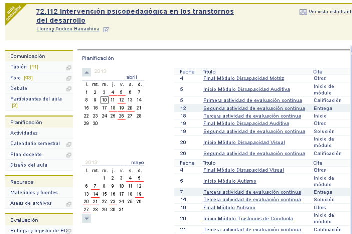
Imagen 2. Imagen de un aula virtual.

asignatura en los diversos soportes y formatos (pdf, audioLibro, videoLibro, obipocket, ePub, etc.). Finalmente el aula recoge un espacio de evaluación donde los estudiantes entregan los trabajos y el profesor pone las notas. También existen diferentes herramientas y sistemas por las que el estudiante recibe el feedback de sus trabajos.