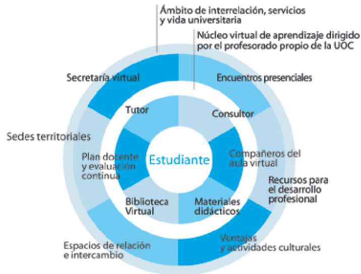
Imagen 1. Representación del modelo pedagógico de la UOC con el estudiante en el centro del proceso.

En este modelo basado en el uso de las TIC's se diferencia entre el núcleo virtual de aprendizaje y el ámbito de interrelación . En el centro del núcleo virtual de aprendizaje se encuentra el alumno como protagonista del proceso de enseñanza-aprendizaje, que debe aprender a aprender, desarrollar habilidades para manejar y transformar la información, conocer las técnicas del autoaprendizaje (como la gestión y planificación del tiempo, entre otras) y dominar el uso de las TIC'S.