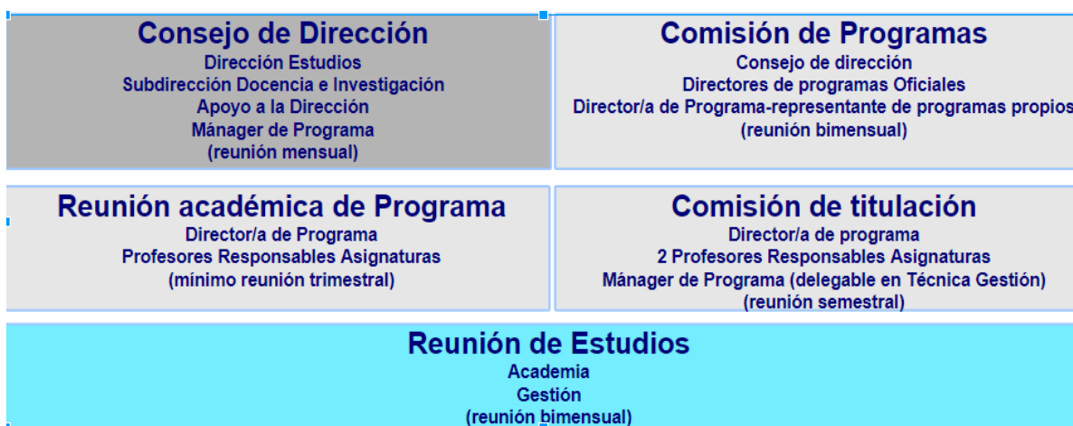
Figura 1. Estructura del sistema de governança i coordinació dels Estudis de Ciències de la Salut

Els Estudis de Ciències de la Salut, i, per tant, el programa avaluat aquí, disposen de diferents mecanismes de coordinació docent adequats, tant presencials com virtuals. Per organitzar-se, els Estudis de Ciències de la Salut disposen d'un sistema de governança ( Evidència 1.1 Governança Estudis Ciències Salut ) que facilita la coordinació i la presa de decisions. Les diferents comissions i reunions també tenen la funció d'analitzar els resultats dels programes, compartir bones pràctiques i debatre possibles propostes de millora aplicables a cada programa o de manera transversal.