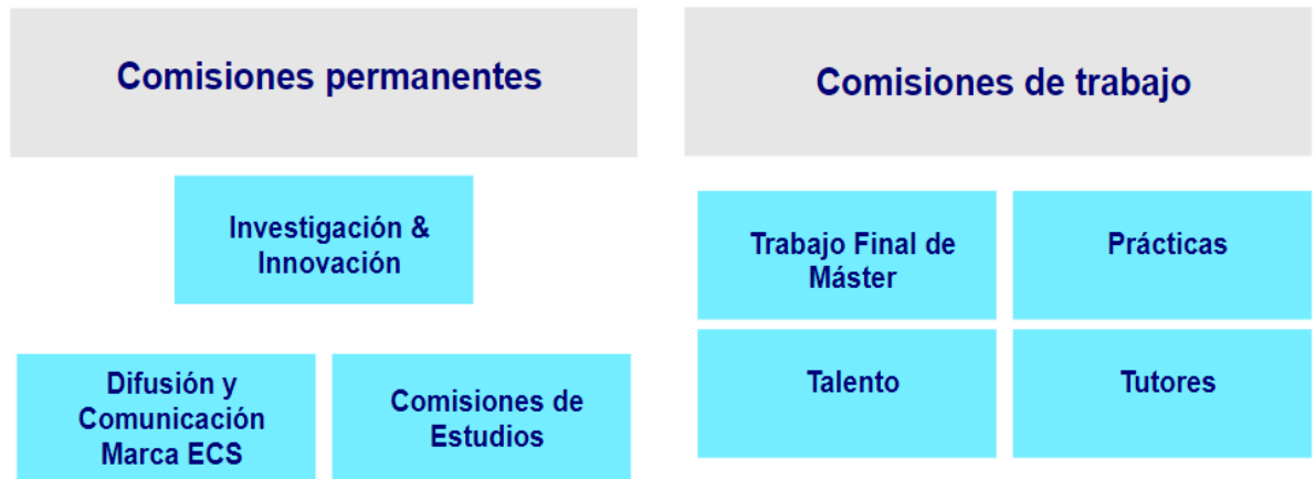
Figura 2. Estructura de les comissions i els grups de treball dels Estudis de Ciències de la Salut

El programa de Neuropsicologia, dins d'aquesta estructura, realitza reunions periòdiques de programa ( Evidència 1.2 Actes reunions generals MU Neuropsicologia ) en què estan implicats els diferents professors del programa. A més, disposa de dues sales virtuals de treball que, coordinades per la direcció del programa, tenen com a objectiu mantenir una comunicació fluïda entre tot l'equip docent del màster (professors, professors col·laboradors, tutors i personal de gestió), ja que en ella es comparteix entre tots els implicats en la titulació qualsevol informació d'interès tant per a l'acció docent com per a la neuropsicologia com a disciplina.