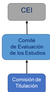
Imatge 1. Esquema de treball del Comitè d'Avaluació Intern (CAI).

Els documents de referència per a l'elaboració de l'autoinforme han estat la Guia per a l'acreditació de les titulacions oficials de grau i màster (juliol de 2019) i el document Evidències i indicadors recomanats per a l'acreditació de graus i màsters (març de 2016) d'AQU Catalunya.